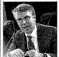
Servizi e TURANI ■ Alle p. 6 e 7

L'ITALIA DEI FURBI Rapporto choc: evasione e frodi valgono miliardi