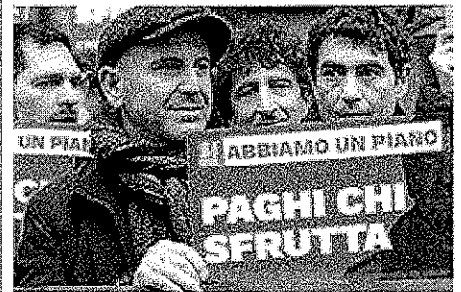
BONZI e GOZZI ■ Alle pagine 4 e 5

LAVORO, SPUNTA L'IPOTESI MINI JOBS Cancellati i voucher, l'ira di Confindustria: meglio il referendum